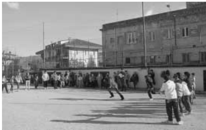
4 dicembre: oratorio day

tanti interessi, dove cresce l'amicizia e dove tutti abbiamo un amico comune di nome Gesù. La visita del nostro Arcivescovo si è conclusa con la solenne benedizione su tutti noi, grandi e piccoli perché questa nuova realtà dell'oratorio, aperto da quasi due anni, si riveli luogo accogliente e terreno di crescita per la nostra fede nello splendido dono di noi stessi al servizio dei fratelli. Grazie per questa visita gradita, che ci fa sentire uniti alla nostra Diocesi, che ci ha dato i mezzi e il coraggio di poter realizzare il sogno di un oratorio, già da tempo celato nei nostri cuori.