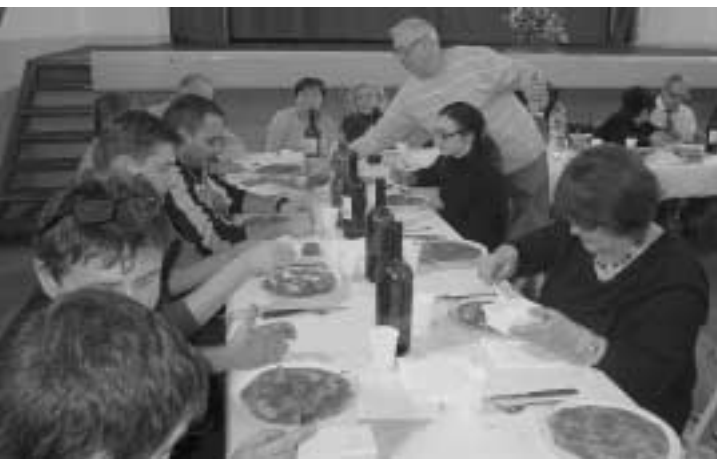
S. Martino: la bella polenta ...