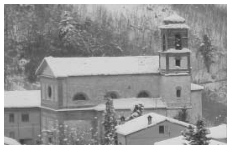
La chiesa di S. Francesco ed il suo campanile ... oggi

S. Eccellenza consacra 6 campane rifuse dalla Ditta De Paoli di Udine tra l'esultanza dell'intera popolazione. Nella Chiesa di san Francesco si è svolta la cerimonia. Anche i più lontani dalla Chiesa, attratti dalla novità della cerimonia, hanno pianto di commozione quando i padrini, piccoli e grandi hanno fatto il loro ufficio. (dall'Appennino Camerte 2-1-1954)