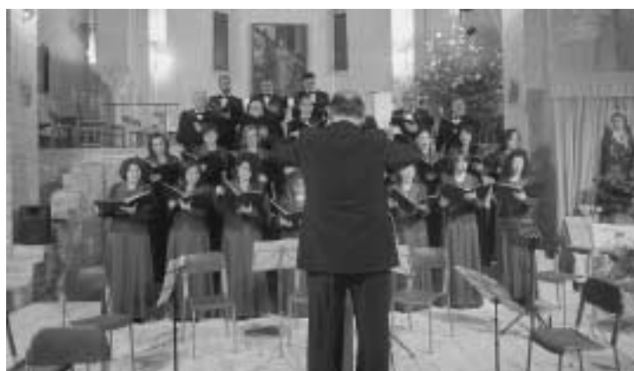
11-12-2011: musica di qualità con coro e orchestra della Santa Casa