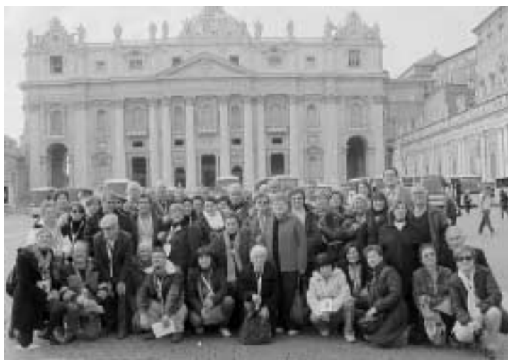
Roma: gruppo Caritas diocesano

A 40 anni dalla sua nascita Caritas Italiana festeggia il suo grande impegno fra gli ultimi, nel disagio e ai confini. Da quel lontano 2 luglio 1271, quando grazie a Paolo VI fu istituita, la società è notevolmente cambiata, ma la Caritas conserva la finalità prioritaria per cui è nata: educare a prestare attenzione ai fratelli più poveri e deboli, coinvolgendo la comunità nei bisogni di tutti. "Amatevi come io vi ho amato": da qui possiamo trarre il vero senso del nostro essere cristiano: il rapporto con le persone, l'ascolto delle loro necessità e il rapporto privilegiato con i poveri, i sofferenti e gli emarginati. Al termine del convegno organizzato a Fiuggi dalla Caritas italiana per ricordare il quarantesimo di fondazione, ci siamo ritrovati giovedì 24 novembre, una cinquantina della nostra Diocesi insieme a migliaia da tutta Italia a riempire la Basilica di S. Pietro per una solenne celebrazione presieduta dal Card. Angelo Bagnasco, Presidente della CEI. Nella sua omelia ha ricordato i meritevoli pionieri, i Direttori e i molti collaboratori che si sono avvicendati negli anni, rinnovando infinita gratitudine e stima. Nelle sue parole è stato espresso chiaramente come il cristiano di oggi non può sottrarsi alla via della fedeltà e del coraggio di fronte alle