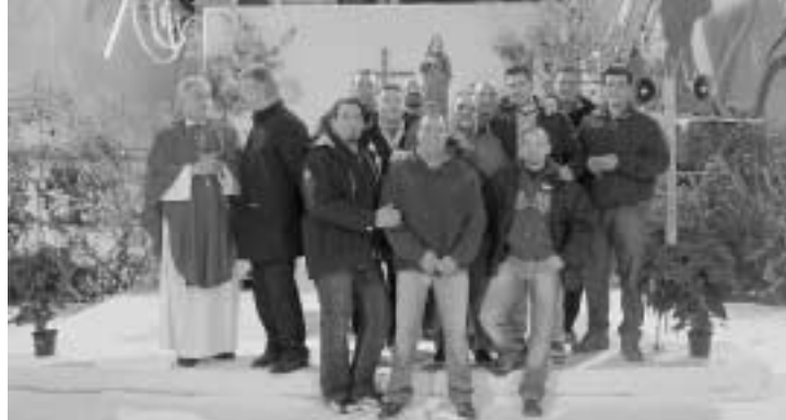
2 dicembre: celebrazione di S. Barbara presso la ditta "Impresa"