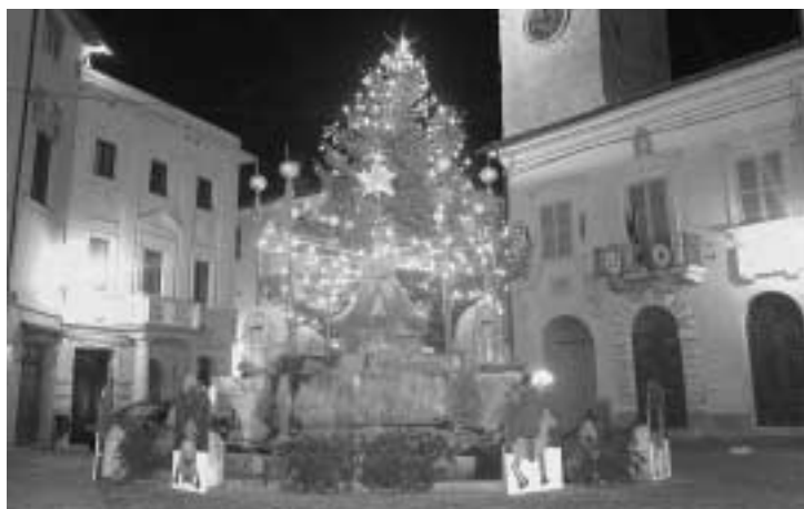
La Piazza in vesti natalizie