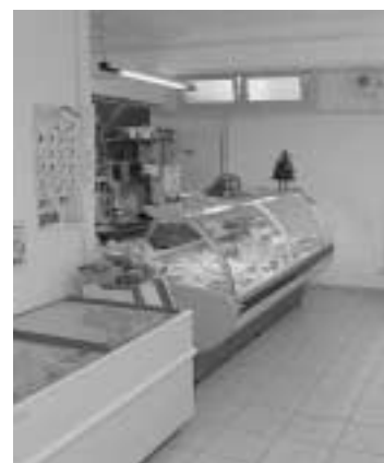
Nuovo bar e alimentari